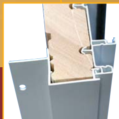
Lame de clouage