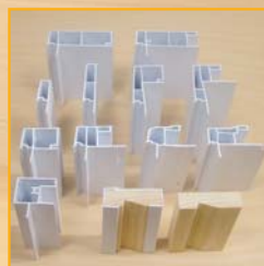
Choix de moulures intérieures et extérieures