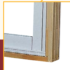
Cadre de pin