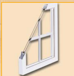
Carrelage intérieur géorgien