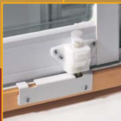
Barrure au pied (serrure d'appoint)